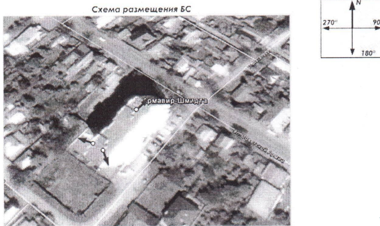
Схема размещения АФУ